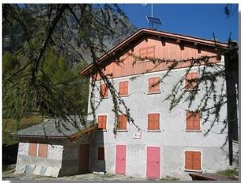
Il rifugio Mitta

Siamo ormai in prossimità del Dosso dei Vetti, da cui si intravede il tetto del vecchio rifugio Scerscen. Subito a valle della seggiovia ci si innesta, infatti, sulla storica mulattiera che dal fondovalle della Valmalenco portava alla capanna Marinelli, prima della costruzione della carrozzabile di Franscia. Il rifugio costituiva quindi una sosta obbligata per quanti salivano a piedi da Lanzada. Invece di scendere a destra al maggengo (a 1800 m, il più alto della valle), si percorre a sinistra – N (cartello Musella) la