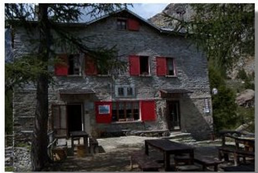
Il rifugio Carlo Bosio Anna Galli

Inizia ora l'unico tratto veramente faticoso del percorso (localmente detto il Calvario): un ripidissimo strappo sul filo del burrone, che consente di guadagnare un centinaio di metri di quota e portarsi su un dosso erboso. Ecco ora la parte più piacevole della