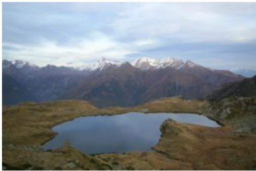
Il lago di Arcoglio

Dal lato meridionale del rifugio parte una traccia che si innalza gradatamente in un bel bosco di conifere e raggiunge le vastissime praterie dell'Alpe Arcoglio (1916 m). Qui si abbandona un sentierino che prosegue verso S in direzione del colletto di quota 2313, posto tra il Monte Canale e il Monte Arcoglio localmente chiamato Colma d'Arcoglio (quotato ma non nominato sulle carte). Si imbecca invece sulla destra un altro sentiero che sale, assai ripido, verso la spianata sulla quale si distende l'Alpe Arcoglio Superiore, dalla quale ci si porta in lieve ascesa verso