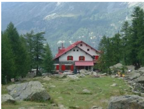
Il rifugio Gerli - Porro

Dal primo lago si sale in direzione NO guadagnando lentamente quota, si supera una vasta distesa di ganda e si vince il pendio finale, ricoperto da nevai semipermanenti che rendono più agevole il cammino. Si perviene così allo stretto intaglio del Passo del Ventina (ore 6.30; 2675 m), originato da una frattura tettonica della cresta fra la Cima del Duca e il Pizzo Rachele, come una selvaggia porta al cuore del Disgrazia, la cui vetta è visibile spostandosi pochi metri a destra del passo. Di fronte al passo si ha invece una bella vista del Pizzo Ventina, con il sospeso e seraccato canalone della Vergine. In discesa dal passo l'orientamento è facilitato dalla costante vista del tetto rosso del Rifugio Gerli-Porro che spicca nel verde dell'alpeggio in fondo alla Val Ventina. Dall'intaglio si scende con una certa precauzione, a causa dei sassi mobili, lungo un sentiero che cala a ripide svolte fra ganda franosa, talora non molto evidente specie all'inizio di stagione. Si attraversa un breve falsopiano e di qui si divalla a un nevaio che si lascia alle spalle piegando un poco a destra ove, al riprendere delle rocce, si ritrovano i segni gialli dell'Alta Via. Suggestiva la visione della vedretta della Ventina e del soprastante Passo Cassandra,