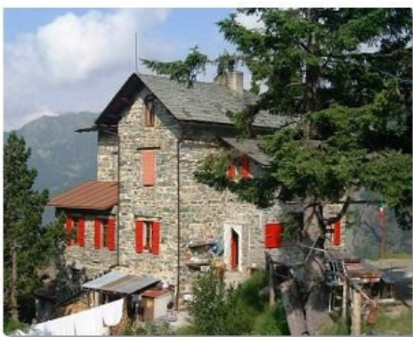
Il rifugio Zoia