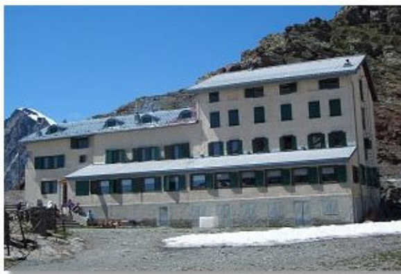
Il rifugio Marinelli