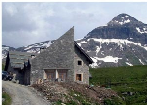
Il rifugio Ca' Runcasch

Per raggiungere il rifugio Zoia si devia a destra per portarsi su di un dosso, poi ci si abbassa con molte svolte tra enormi roccioni punteggiati dalle prime conifere (palestra di roccia attrezzata) e si giunge al rifugio