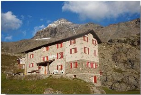
Il rifugio Cristina

Il rifugio Cristina (2287 m) è un'ampia costruzione appartenente alla famiglia Bricalli di Caspoggio, posta in una stupenda conca di origine glaciale, il cui fondo è ancor oggi occupata da una zona torbosa. Dotato di 30 posti letto, è uno dei rifugi più frequentati della valle, sia per la vicinanza della carrozzabile Franscia-Campo Moro (rifugio Zoia-rifugio Cristina, ore 1), sia perché costituisce una comoda base per le salite al Pizzo Scalino. E' aperto con servizio di alberghetto da fine giugno a fine settembre (tel. 0342 452398).