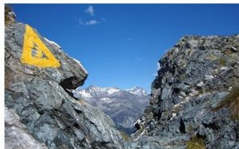
Passo della Corna di Sissone.

Dal rifugio, seguendo oltre alla segnalazione dell'Alta Via anche segnali bianco-rossi, ci si abbassa rapidamente per la linea di massima pendenza, poi si compie un lungo traversone fra numerose vallette incise da torrenti che scendono dal ghiacciaio di Vazzeda, la cui fronte arrotondata è