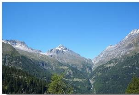
La Valle del Muretto