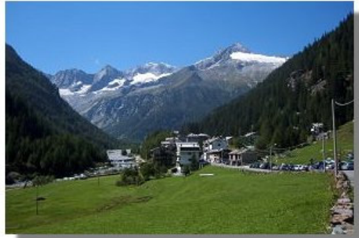
L'abitato di Chiareggio

Ora non resta che proseguire sulla stradella d'accesso che si abbassa a superare il torrente Orlegna, risalendo poi all'ampissima spianata del passo del Maloia (1815 m), valico molto importante che collega l'Engadina e la Valle della Mera e già frequentato sicuramente in epoca romana (ore 2; numerosi alberghi, ufficio turistico, fermata dell'autopostale per St. Moritz e Chiavenna).