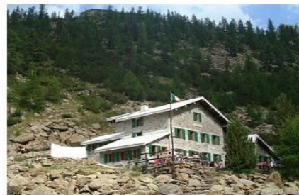
Il rifugio Ventina