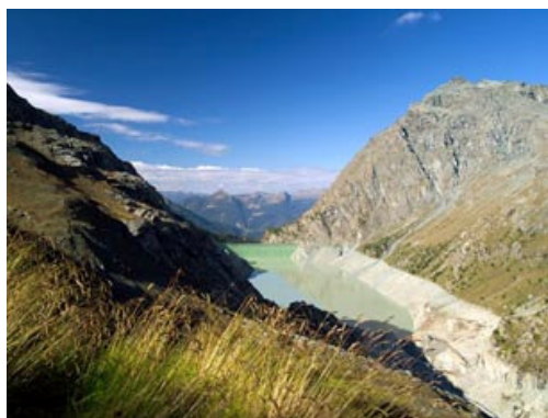
La diga di Alpe Gera

Dal rifugio Bignami si scende per il ben battuto sentiero che costeggia il lato orografico destro del bacino della diga di Gera (2000 m). Al termine della diga, una lunga passerella di cemento, sulla destra, permette di raggiungerne la base in prossimità