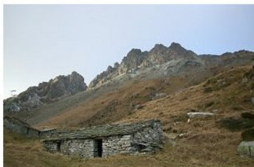
L'Alpe Airale in Val Torreggio

Dall'alpe (fontana; bivio con la variante diretta al Passo Ventina) si scende nel bosco, si supera un valloncetto e ci si abbassa a incrociare il sentiero proveniente dall'Alpe Lago. Lo si segue in direzione N (sinistra), si lascia la diramazione di destra (vedi variante delle cave) e si prosegue fino ad un dosso rivestito da pini mughi, dal quale si ha un'ampia vista sulla valle e sulle sottostanti cave di pietra ollare. Oltrepassata la cava Gaggi (imbocco della galleria: macchinari per il taglio della pietra in loco) si scende a sinistra con stretti tornanti nel fitto della vegetazione e si giunge nella conca incassata del laghetto del Pirlo. Si supera l'emissario e, usciti dal bosco, si raggiungono le baite del maggengo chiuso a NO