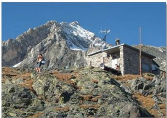
Il rifugio Del Grande Camerini

Dal baitello si riprende una traccia sulla costa di destra (ENE) che dopo una traversa diviene meno evidente. Si sale allora per una decina di metri per la massima pendenza in direzione dei segnavia e, nei pressi di un isolato larice, si ritrova la traccia che immette in un marcato valloncetto. Lo si percorre per metà della sua lunghezza per uscirne sulla sinistra (segnalazioni!) e portarsi sul filo di un piatto crestone, sul quale