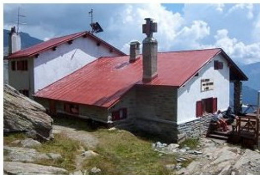
Il rifugio Longoni