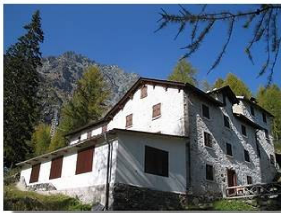
Il rifugio Musella

Dal ponte appare evidente la strada che da percorrere fino al rifugio Carate Brianza, che rimane per qualche tempo nascosto da uno sperone del Monte delle Forbici. E' il tratto più faticoso della tappa, costituito da una serie ininterrotta di dossi, di balze di sfasciame e di magri pascoli detti localmente "sette sospiri"; in realtà sono una serie di gobbe moreniche che costituiscono un antico rock glacier ormai stabilizzato (rock glacier fossile). Si traversa la zona di pascolo, si risale il primo sospiro tra larici che diventano via via più radi e si raggiunge un gruppo di baite che si lasciano sulla destra. Si continua a salire per un valloncetto pietroso fino a intersecare il sentiero che, costeggiando le pendici del Sasso Moro, proviene dalla diga di Campo Moro (la via diretta per chi voglia portarsi in giornata alla capanna Marinelli). Vinte altre due balze, si perviene a una spianata occupata, in parte, da un piccolo laghetto sovrastato dalle Cime di Musella che chiudono a N la conca. La mulattiera prosegue ripida e faticosa, supera a