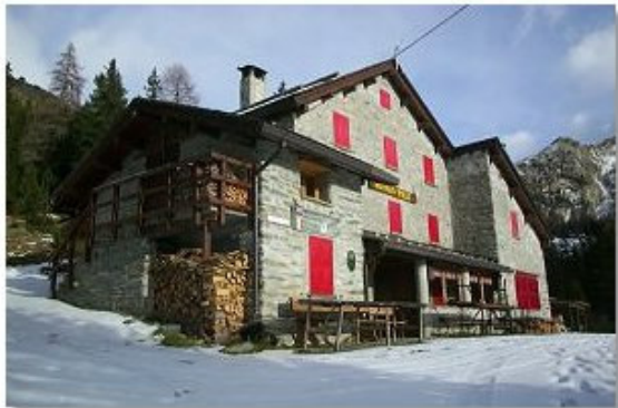
Il rifugio Lago Palù

Non rimane che "tuffarsi" nella sua direzione, prima ripidamente tra mughi, poi con lunghe traversate nel fitto della pecceta. Si giunge così alle praterie dell'Alpe Loggione dove si piega a destra subito dopo l'alta croce e in pochi minuti si raggiunge il rifugio (1947 m; ore 7).