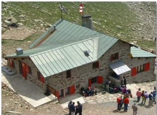
Il rifugio Carate Brianza

Dal rifugio si sale in breve alla Bocchetta delle Forbici, uno dei luoghi magici delle Alpi, che schiude un'improvvisa quanto grandiosa vista sulla parte occidentale del Gruppo del Bernina e in particolare sulla seraccata del ghiacciaio dello Scerscen Superiore e sulla bifida cima del Pizzo Roseg. A questo punto si prosegue per il sentiero che scende leggermente, continua in costa, aggira in basso lo sperone del Monumento degli Alpini (corde fisse per gli sciatori alpinisti; vedi variante) e continua su una serie di dossi pianeggianti tagliando la parete nord-occidentale della Cima di Musella. Si attraversa un laghetto, si oltrepassa il cippo con i resti dell'elicottero che ancora ricordano la disgrazia del 1957, nella quale perirono il maggiore pilota Pagano e Gino Bombardieri, e si scavalca su di un ponticello il torrente che esce dalla lingua della Vedretta di Caspoggio, che ormai si è ritirata a quota più elevata. Non rimane ormai che risalire, a corti zig zag, il costolone sulla cui sommità, ai margini di un ampio terrazzo sorge il rifugio Damiano Marinelli e