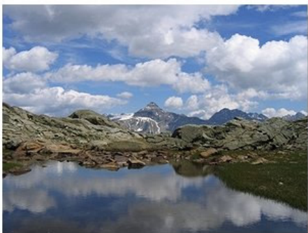
Il Pizzo Scalino visto dal Sasso Nero

Variante faticosa ma di grande interesse, che permette di raggiungere una delle cime più panoramiche della valle. Facile, benché segnalata deve essere intrapresa solo in buone condizioni di visibilità.