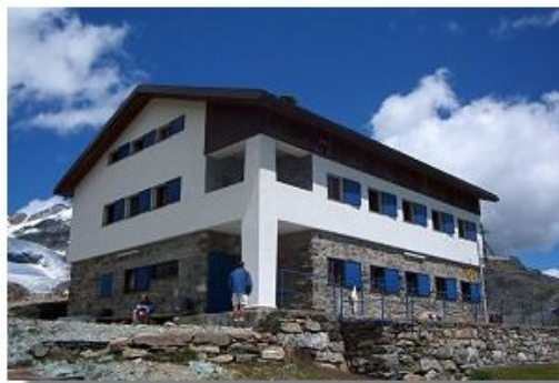
Il rifugio Bignami

Dal rifugio si divalla per qualche tornante lungo l'itinerario di accesso al rifugio per poi prendere a sinistra la traccia di sentiero che taglia in quota su sfasciumi e chiazze di neve, sotto le pendici della Punta Marinelli, e consente di raggiungere la vedretta all'altezza della sua conca superiore. Da qui si sale sempre in diagonale fino al valico tra la Cima di Fellaria e la Cima di Caspoggio (ore 2; 2983 m). Dalla bocchetta ci si abbassa per una placca rocciosa (attenzione; corda fissa), poi per un lungo canalone ingombro di morena, facendo attenzione a non spostarsi troppo verso destra. Giunti a un ripiano, si piega decisamente a sinistra verso la cresta che separa questo bacino da quello di Fellaria. Dopo un altro tratto ripido, si scende più dolcemente, mentre la traccia di sentiero si fa man mano più evidente. Una vasta conca percorsa da alcuni torrentelli, prelude ai pascoli della vicina Alpe Fellaria alla quale si perviene dopo avere effettuato un guado e risalito, ormai su sentiero ben tracciato, un breve pendio. L'alpeggio, purtroppo in gran parte costituito da ruderi di baite, era probabilmente il più elevato di tutta la Valmalenco e dista poche centinaia di metri dal rifugio Bignami (2401 m).