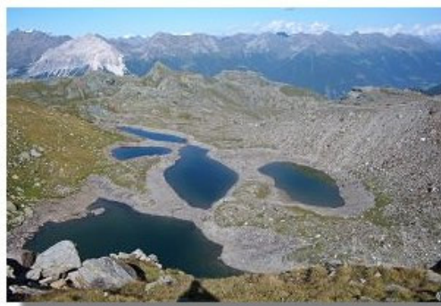
I laghetti nei pressi del Passo di Canciano

Scavalcato il torrente su di un ponte (a destra, sulla parete rocciosa perfetti esempi di piccole marmitte dei giganti, segnalate con il triangolo giallo), si oltrepassano le baite in gran parte ristrutturata. Si procede lungo una traccia di sentiero in direzione di un secondo gradino della valle, costeggiando sempre il torrente e tenendosi generalmente a mezza costa per evitare le zone paludose. Vinto anche il secondo gradino (stop 5), si perviene a una seconda e più ampia spianata, il cui fondo è occupato in buona parte da palude. Alle spalle si apre, via via più maestosa, la vista sull'intero Gruppo del Bernina. Il terzo gradino, meno ripido e stretto dei precedenti, è caratterizzato da grandi blocchi franati dal Monte Spondascia che ricoprono il fondovalle. Lo si risale e si arriva al bacino terminale della Valle Poschiavina. Dopo un breve tratto lungo il greto del torrente, ci si