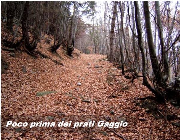
Poco prima dei prati Gaggio